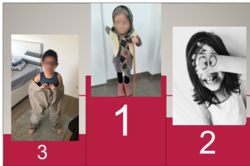
Podium du concours de la photo la plus rigolote

La maîtresse de la classe a organisé le concours de la photo la plus rigolote. Les élèves ont tous fait preuve d'une grande imagination ! Cependant il fallait choisir des gagnants. En première place nous avons élu R. dans son déguisement de grand-mère, suivie d'A. et d'I. Bravo à tous !