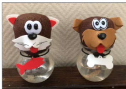
Voici Minou le chat des CE1-CE2 et Toto le chien des CP !

Lundi 9 mars, les classes de CP et de CE1-CE2 ont fait la connaissance de deux adorables têtes à herbe qu'ils ont nommées Minou et Toto.